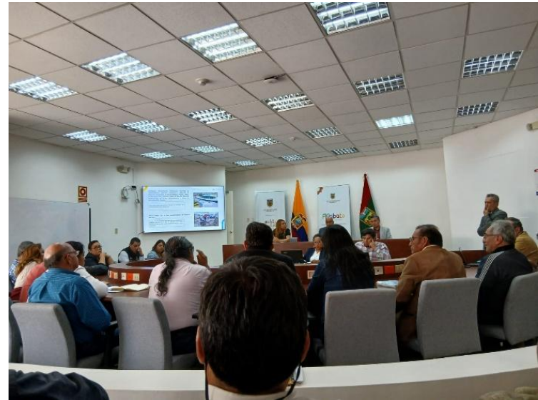
Nota: asistencia a la reunión en el GADMA.