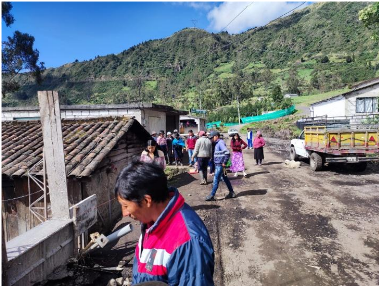
Nota: primera visita al proyecto vial La Estancia.